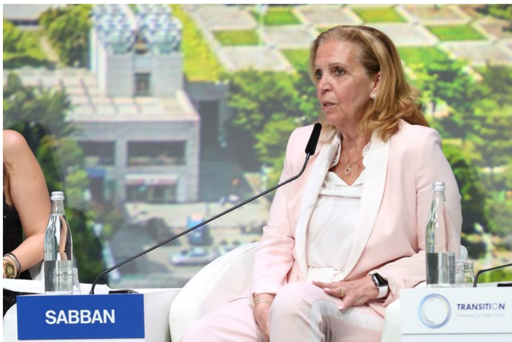
Participation au Transition Monaco Forum | Juin 2018

Juin : Présence au déjeuner des leaders environnementaux organisé par la Fédération Française du Tennis en marge de Roland Garros et début des discussions pour la mise en place d'un partenariat avec la FFT sur des questions liées à la reforestation + Participation aux rendez-vous BtoB organisés par l'ADEME pour mettre en relation des financeurs de la transition énergétique et des porteurs de projets sains + Participation à la finale du Jury d'experts du Prix Convergence pour choisir le lauréat du Prix + Participation au Transition Monaco Forum (26/27 Juin 2018) en tant que partenaire organisateur et en tant que speaker, animation d'un atelier avec nos partenaires présents.