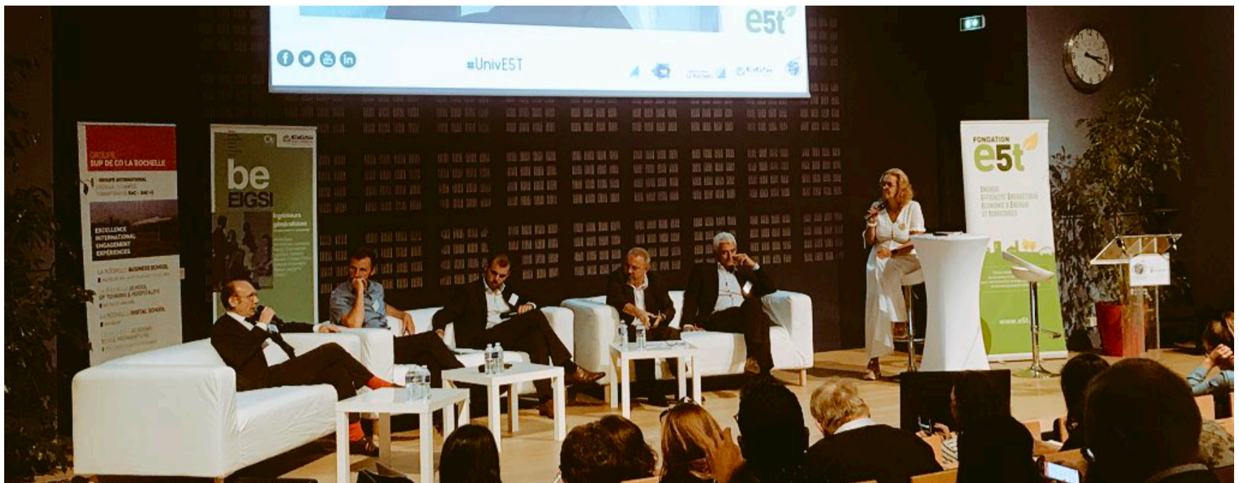
Intervention et animation d'un débat aux universités d'Été de La Rochelle, organisées par E5T et Économie d'Énergie | Août 2018

Septembre : Participation et intervention lors du 10 ème Forum Mondial Convergences sur la thématique des villes actrices de la transition + Participation à la remise du prix convergence + Intervention à la conférence « Biomimexpo : quand la nature inspire l'innovation » + Initiation des travaux sur le projet KITA AKUO/JMI/Fonds vert R20 pour les femmes en appui à des productions de soja, maraichage et jatropha avec les femmes dans un cadre contractuel et agroforestier + Déplacement à New York dans le cadre de la Climate Week et de l'Assemblée Générale des Nations Unies . Participation à de nombreux événements de haut-niveau : ART 2030 NEW YORK, Pacte mondial de l'environnement, One Planet Summit, Goalkeepers etc. Tenue et animation d'un side event sur la thématique « Challenges & Opportunities to create a Sustainable and Gender Balanced Economy » en partenariat avec UN WOMEN et la European American Chamber of Commerce + Déplacement au Havre pour intervenir lors du LH Forum sur la thématique « ces territoires de plus en plus engagés dans la transition énergétique » .