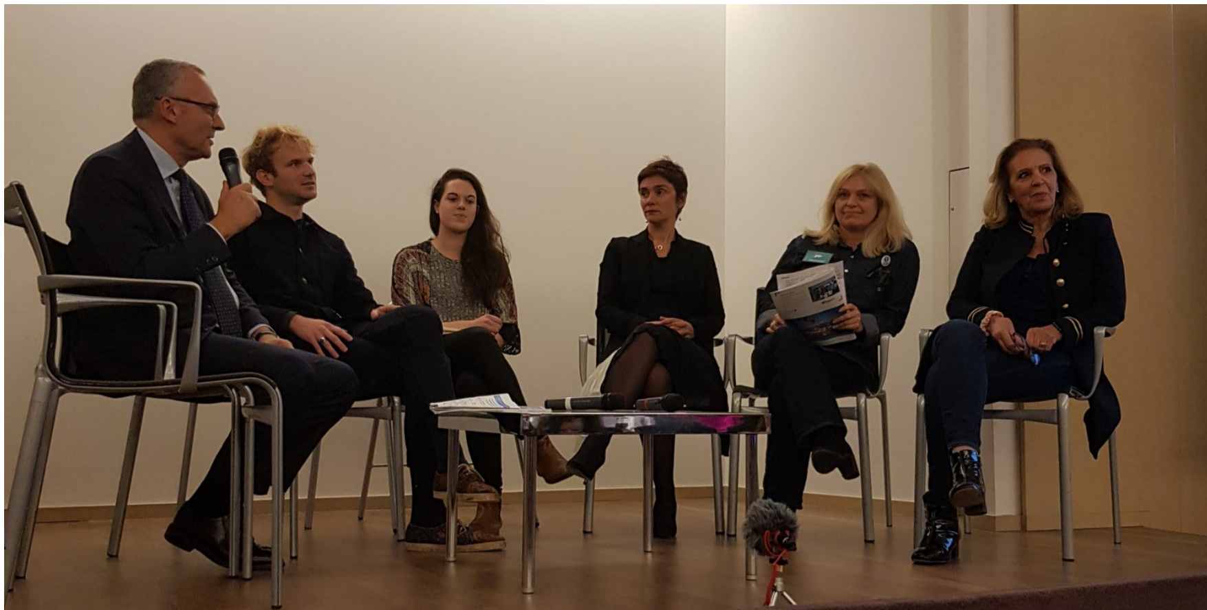
Événement «Femmes santé et climat» | Décembre 2018