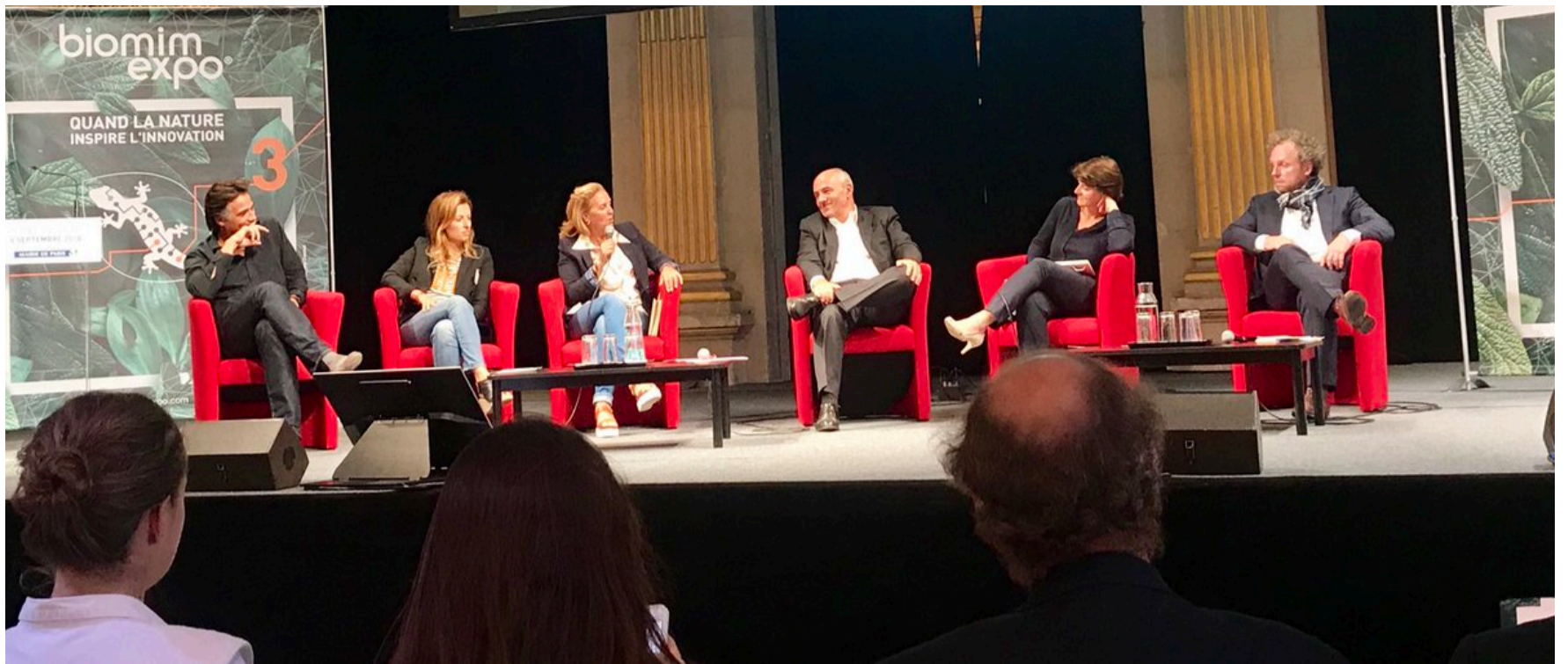
Conférence Biomimexpo | Septembre 2018