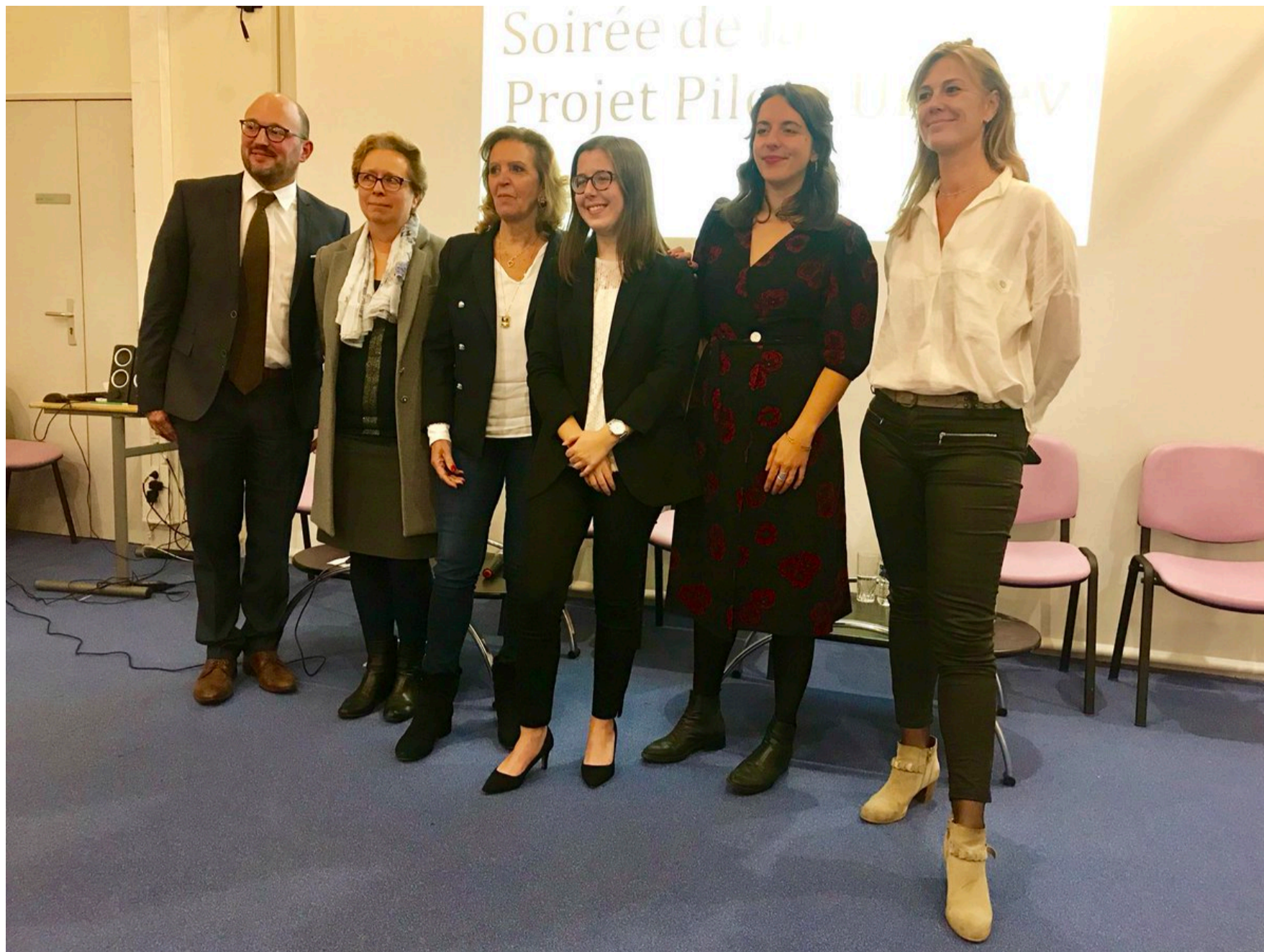
Intervention au lycée Paul Émile Victor d'Osny (en partenariat avec UNICEF) | Novembre 2018

Décembre : Speaker à l'événement « Femmes santé et climat » organisée par les réseaux de femmes « Supplément d'Elles », « Femmes et Développement durable » et la BPI France + Déplacement à Abidjan, Cote d'Ivoire pour avancer sur nos différents projets de terrain et travailler à structurer le financement pour « Projet d'exploitation agricole de gingembre sous-bois », beaucoup de rendez-vous sur place (AFD, Ambassade, Ministre de la Salubrité, Comité de pilotage du Projet, Cabinet de la Première Dame, ARDCI etc.) + Remise des trophées Positive Planet + Rencontre avec les équipes du Ministre de la Transition Ecologique et solidaire pour présenter le SnCF for Africa développé par le R20 Genève, et promouvoir son lancement lors du OPS de Nairobi (mars 2019) + Participation au Women Daring Circle 2 + Travail avec les équipes du FMDV et de l'UEMOA sur le développement d'un projet « Institutrices du climat » en réponse au programme « 0 Enfants des rues » lancé par le Roi du Maroc lors du Sommet Africités.