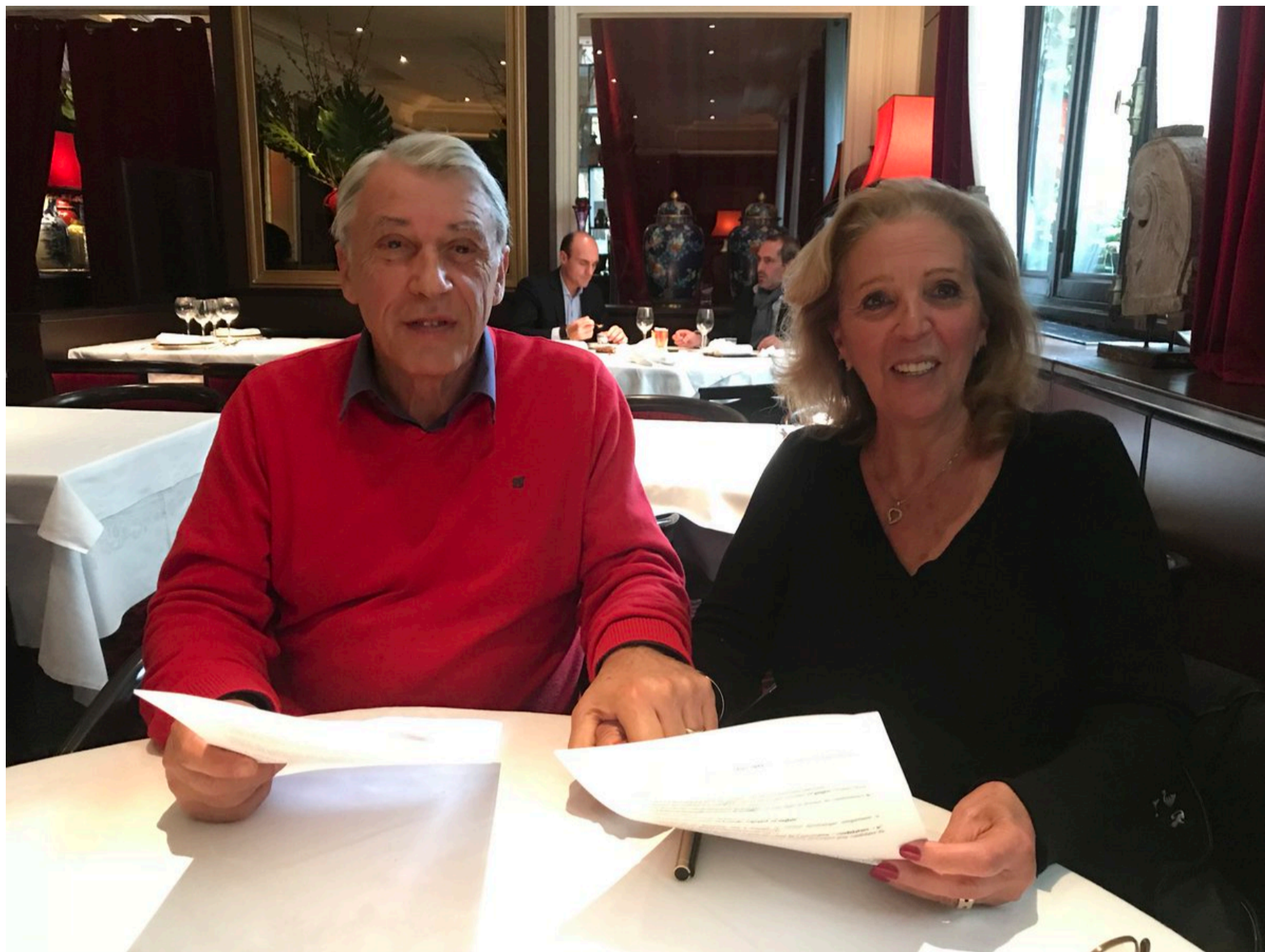
Signature Partenariat France Libertés | Octobre 2018

Novembre : Participation en tant qu'expert au 1er Women&Climate Daring Circle Workshop mis en place par les équipes du Women Forum + Participation à la réunion de la Task Force Ville Durable de MEDEF International en tant que partenaire de l'initiative + Intervention au lycée Paul Émile Victor d'Osny pour valoriser et encourager les projets soutenus et développés par les lycéens et leurs professeurs (en partenariat avec UNICEF ) + Participation à la conférence : « Transition énergétique, comment l'accélérer ? » organisée par notre partenaire GCFT + Participation au Women's Forum pour présenter les travaux du Women&Climate Daring Circle et fixer les prochains travaux + Présence au Global Positive Forum organisé par Positive Planet pour présenter les travaux du groupe d'experts environnement « Positive Planet » et les propositions retenues + Participation au Jury d'experts sur l'appel à projet Eau et Climat avec France Libertés et désignation des trois projets vainqueurs qui seront financés.