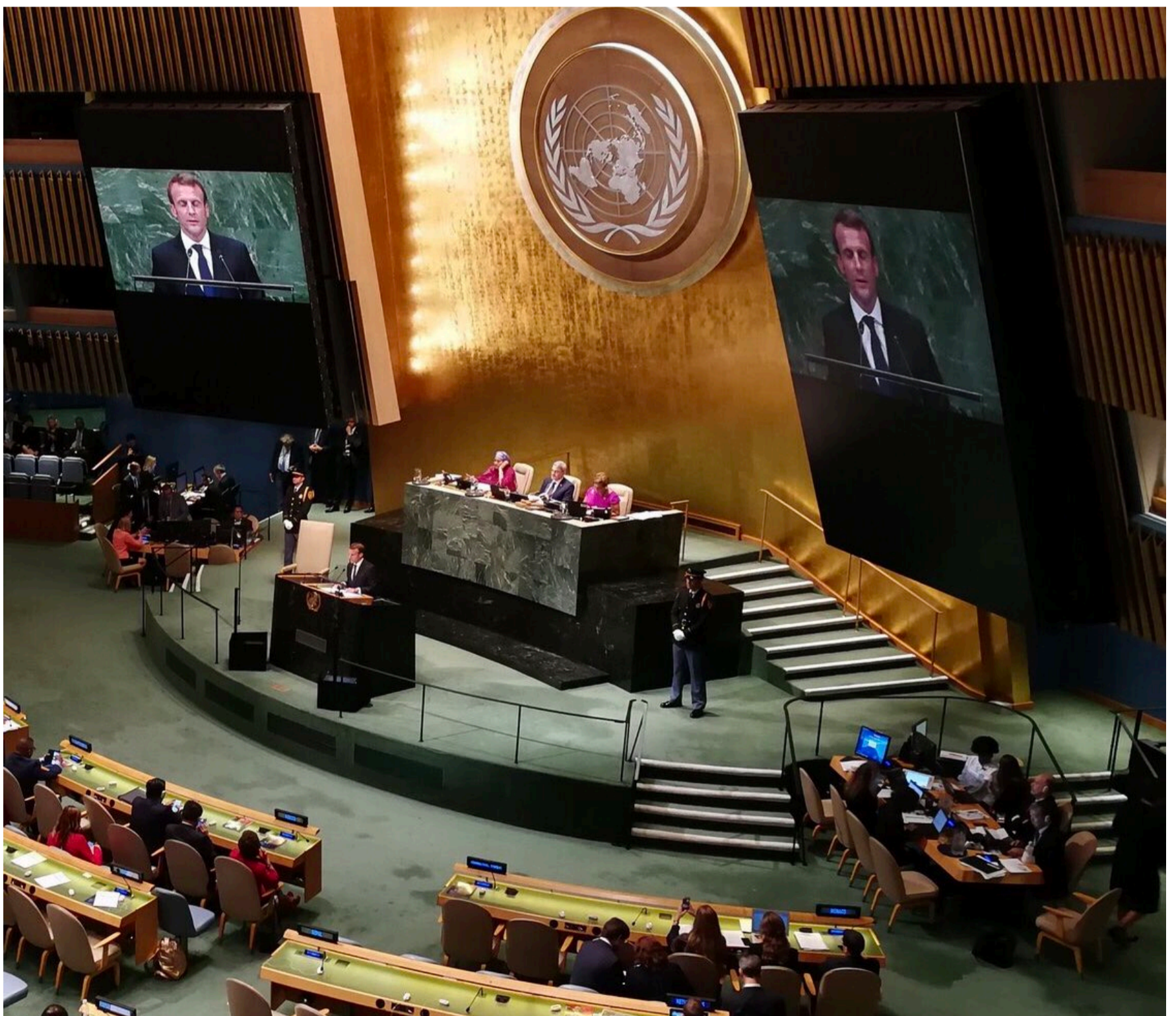
Discours du Président E. Macron dans l'enceinte de l'ONU NY | Septembre 2018