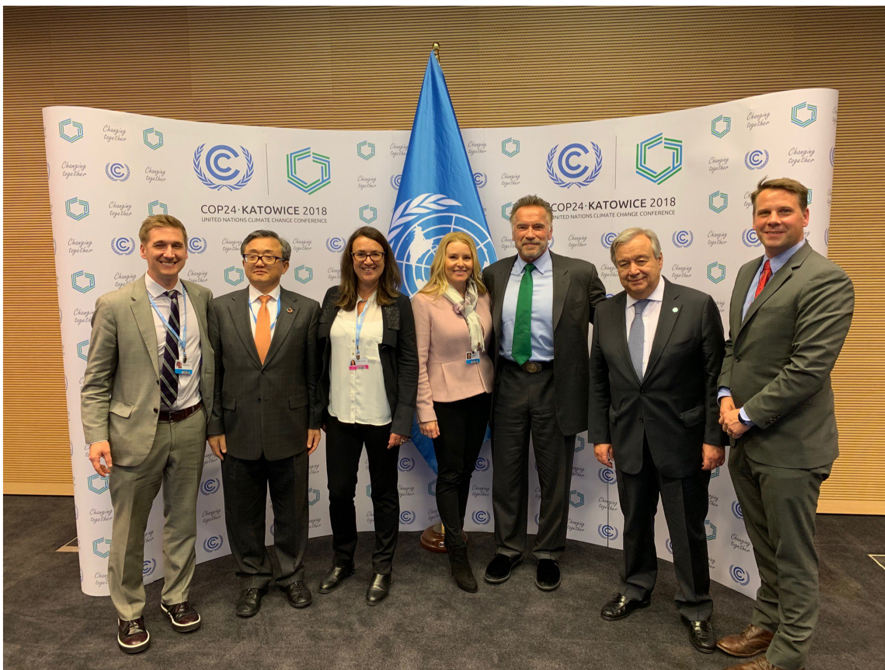
Équipe R20 COP24 | Décembre 2018