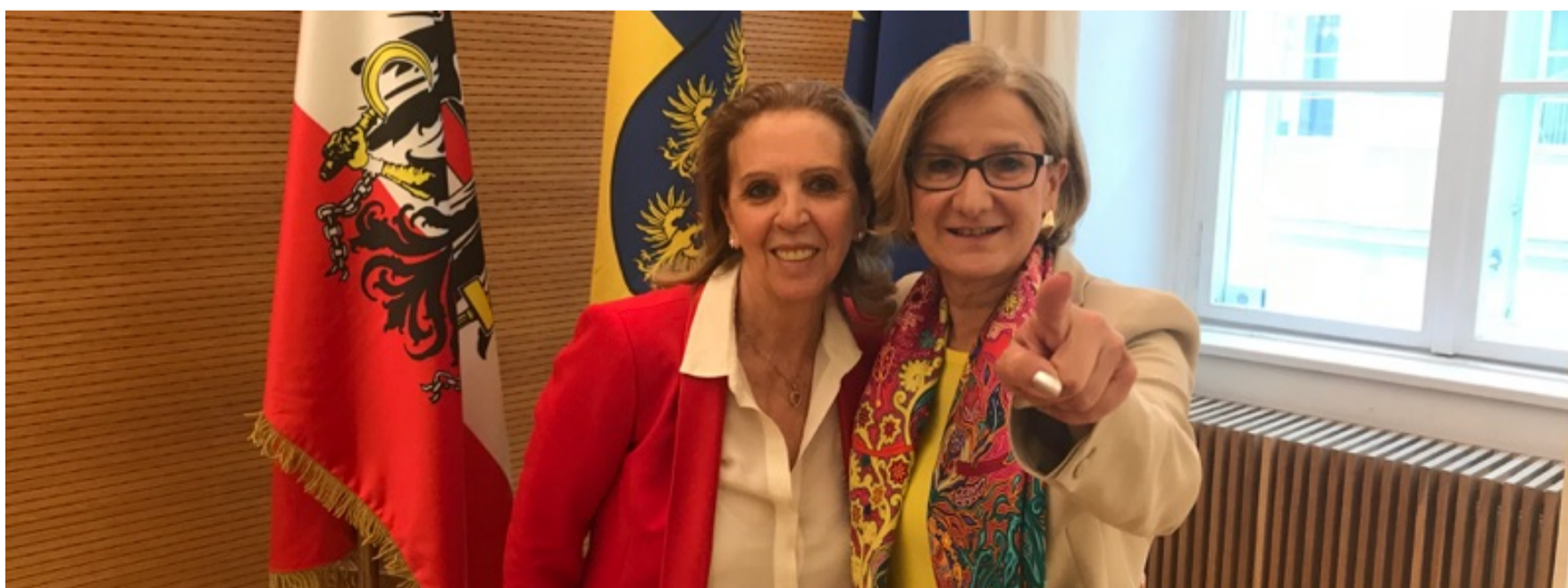
R20 Austrian World Summit | Mai 2018

Mai : Première prise de contact avec la Fondation France Libertés pour travailler à un appel à projet commun sur les thématiques de la gestion et de la préservation de l'eau + Participation au R20 Austrian World Summit organisé par le bureau autrichien du R20 + Participation au 1 er tour du Jury d'experts du Prix Convergence récompensant les projets de partenaires solidaires, publics et privés, engagés pour un avenir équitable et durable et un monde «Zéro exclusion, Zéro carbone, Zéro pauvreté» + Participation au Débat « Neutralité Carbone » organisé par notre partenaire EDF + Travaux d'organisation du Transition Monaco Forum (26/27 Juin 2018) .