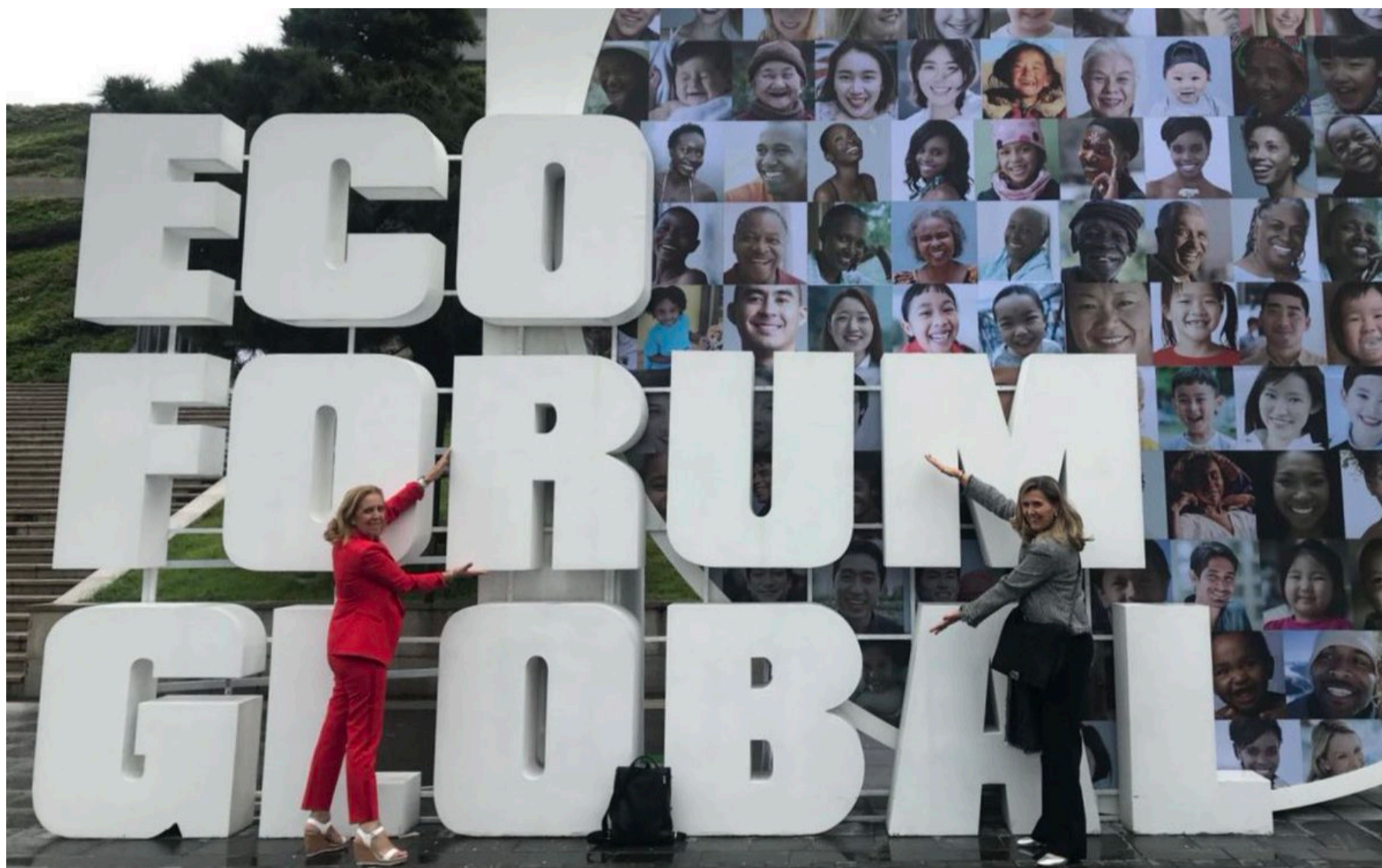
Déplacement en Chine à Guiyang pour participer à l'Eco Forum | Juillet 2018

tenue du World Government Summit (10-12 février 2019) et la création d'un side-event dédié au rôle des femmes leaders dans l'économie verte , Discussion pour établir un partenariat entre le YouthxHub et l'Institut USC Schwarzenegger Institute, mise en place d'un partenariat institutionnel avec IRENA (International Renewable Energy Agency) , rencontre avec les équipes organisatrices de l'Expo 2020 et de UN WOMEN UAE pour monter un partenariat intelligent autour de la place des femmes dans la lutte contre le changement climatique et la création d'un side event pour le WGS et pour Expo2020 + développer des projets dans la région + Déplacement à MASDAR EAU et discussions autour du projet Masdar City , de la « Abu Dhabi sustainability week » et du prix Zayed Sustainability Prize .